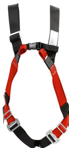
Abb. TS30-2T Vorderseite