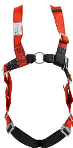
Abb. TS30 Vorderseite

gepr. nach EN 361:2002 (und EN 1497:2007 in der Var. MB30-R)